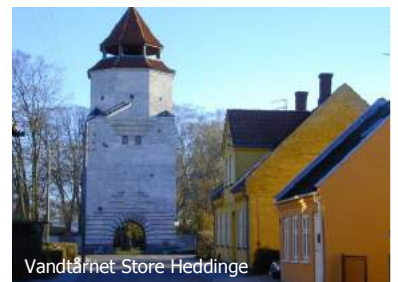
Vandtårnet Store Heddinge