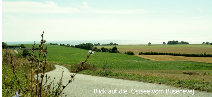
Blick auf die Ostsee vom Busenevej

Tipp: „Møns Klint og Klintholm“ - Wanderführer der dänischen Naturschutzbehörde Naturstyrelsen mit 7 Tourvorschlägen nst.dk