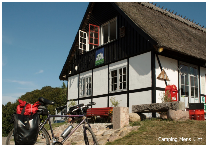
Camping Møns Klint

Verkehr: Waldwege und asphaltierte Landstraßen mit wenig Verkehr. Stark kuppiges Gelände. Route eignet sich auch als Trainingsstrecke für „Bergfahrer“. Räder mit min. 5 Gängen empfohlen. Ungeeignet für jüngere Kinder.