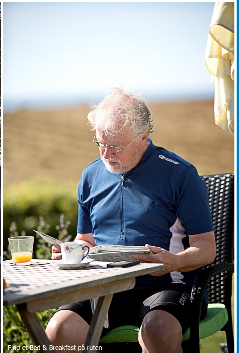
Find et Bed & Breakfast på ruten