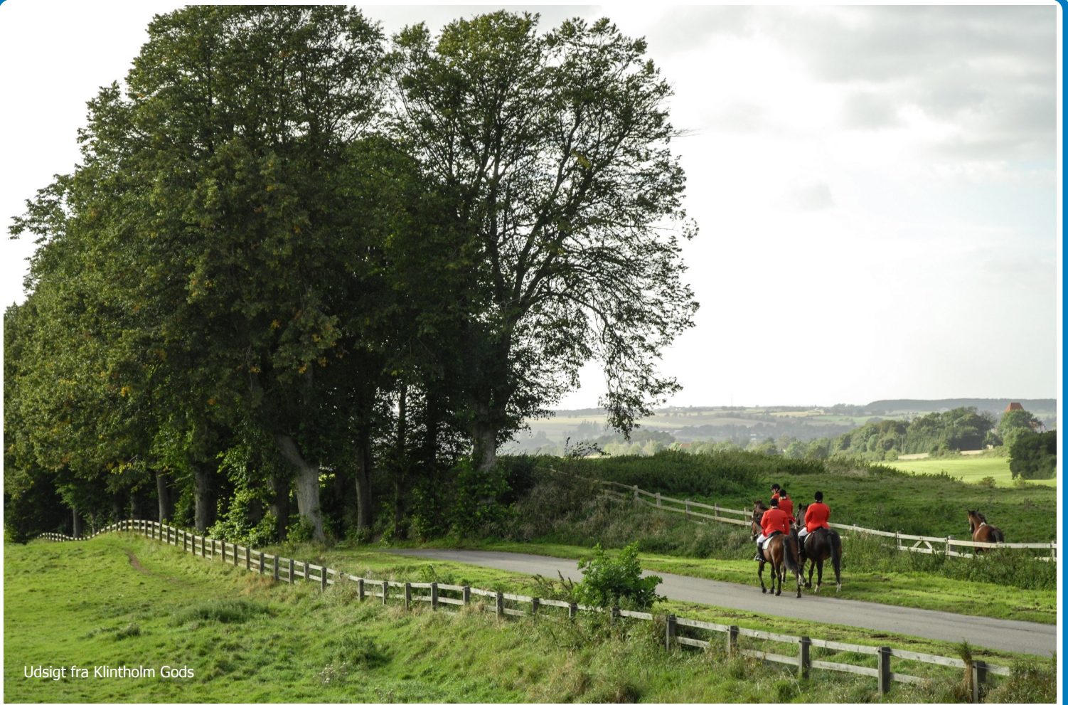
Udsigt fra Klintholm Gods