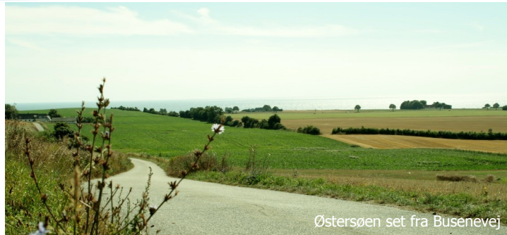
Østersøen set fra Busenevej

Møns Klint (13) er med de klippelignende kridtklinter, den stenede strand og det matgrønne hav en af Danmarks smukkeste kyststrækninger. Se Dronningestolen, det højeste punkt på Møns Klint med sine 128 m over havet. Ifølge sagnet sad Klintekongens dronning her og skuede ud over havet, mens Klintekongen var på togt. Bemærk bøgetræerne med de meget lysegrønne blade og krogede former, der skyldes den kalkrige jord. Med lyden af havet i ørerne og de smukke farveindtryk fra Møns Klint kører du gennem den grønne Klinteskov tilbage til Camping Møns Klint.