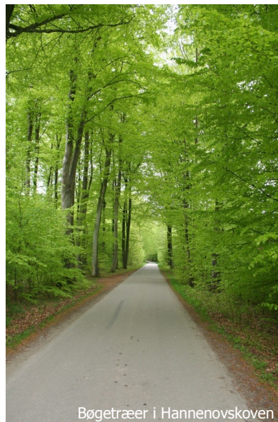
Bøgetræer i Hannenovskoven