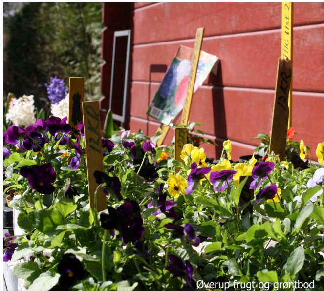
Øverup frugt- og grøntbod