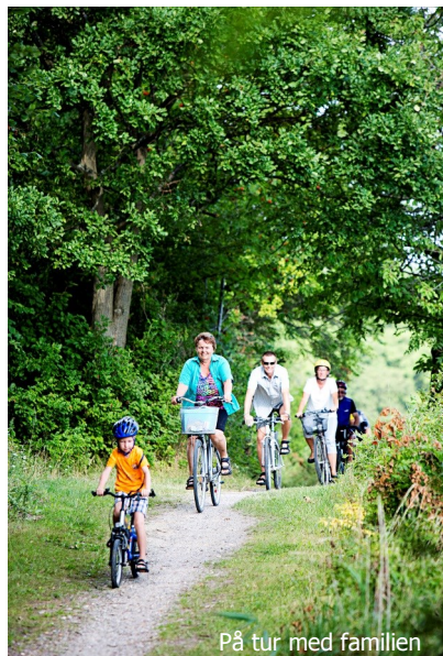
På tur med familien