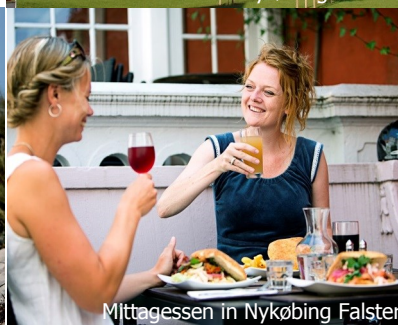
Mittagessen in Nykøbing Falster