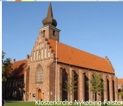
Klosterkirke Nykøbing Falster

Fahrradvermietung bei Spar Marielyst www.spar.dk/boto , Marielyst Fremdenverkehrsinformation www.visitolland-falster.dk/marielystturbureau