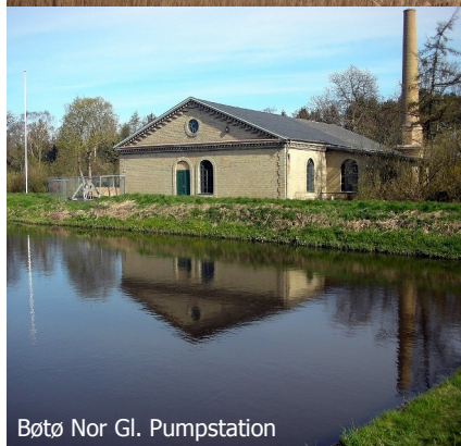
Bøtø Nor Gl. Pumpstation